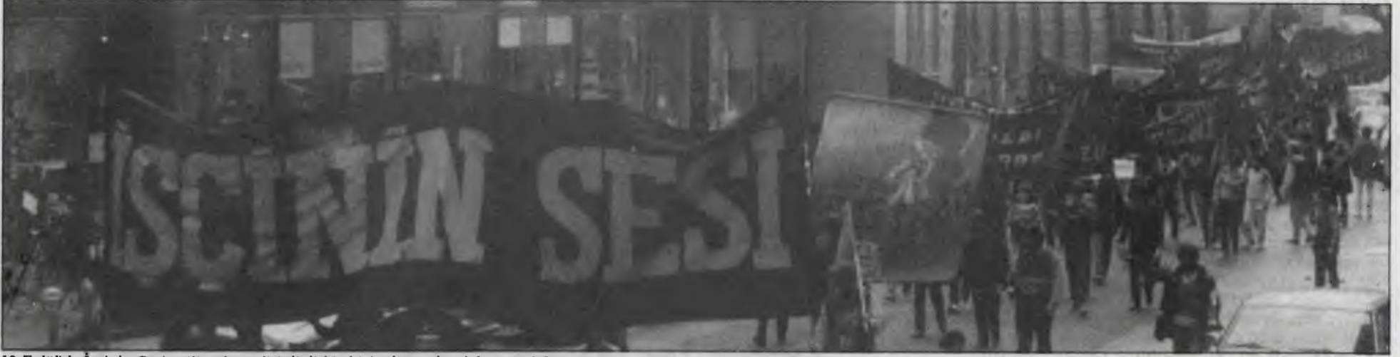
12 Eylül'de İşçinin Sesi militanları, disiplinli bir biçimde, coşku dolu yürüdüler

12 Eylül faşist darbesinin 4. yıldönümünde Avrupa'nın dört bir yanında protesto eylemleri yapıldı.