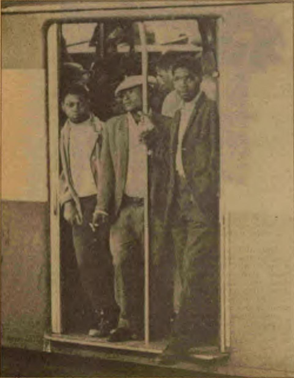
Siyahlar üçüncü mevkide gider

Afrika — ve Güney Afrika — bu global stratejinin dışında değildir. Orada ABD'nin amaçlarına hizmet edecek kadar uysal ve rüşvetle iş görmeye hazır devletler vardır. Polis devleti terörü ile varlıklarını sürdüren ve siyah çoğunluğa baskı uygulayan rejimler için ABD desteği ve yardımı hazırdır. Öyleyse, Namibya'nın haksız işgali ve askeri diktatörlüğü kabul edilebilirdi. Bütün bunlar Washington'un öngördüğü "komünizmin konumlarını geriye itme", rekabet ve bir kıtayı kâr dünyasında uysal bir dışli olabilecek biçimde yeniden