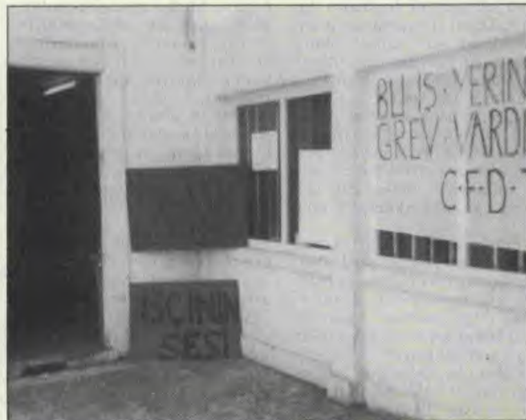
Grev bir okuldur