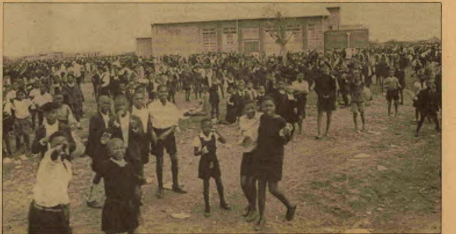
Soweto'da bir okul bahçesi

Nkomati Anlaşması'nın önümüze çıkardığı engelleri, ülke içindeki devrimci süreci pekiştirerek ve genişleterek göğüsleyelim. Mücadeleleriyle kurtuluş hareketimizin köklerini besleyen halkımızın bizi asla yarı yolda bırakmayacağından her zaman emin olabiliriz.