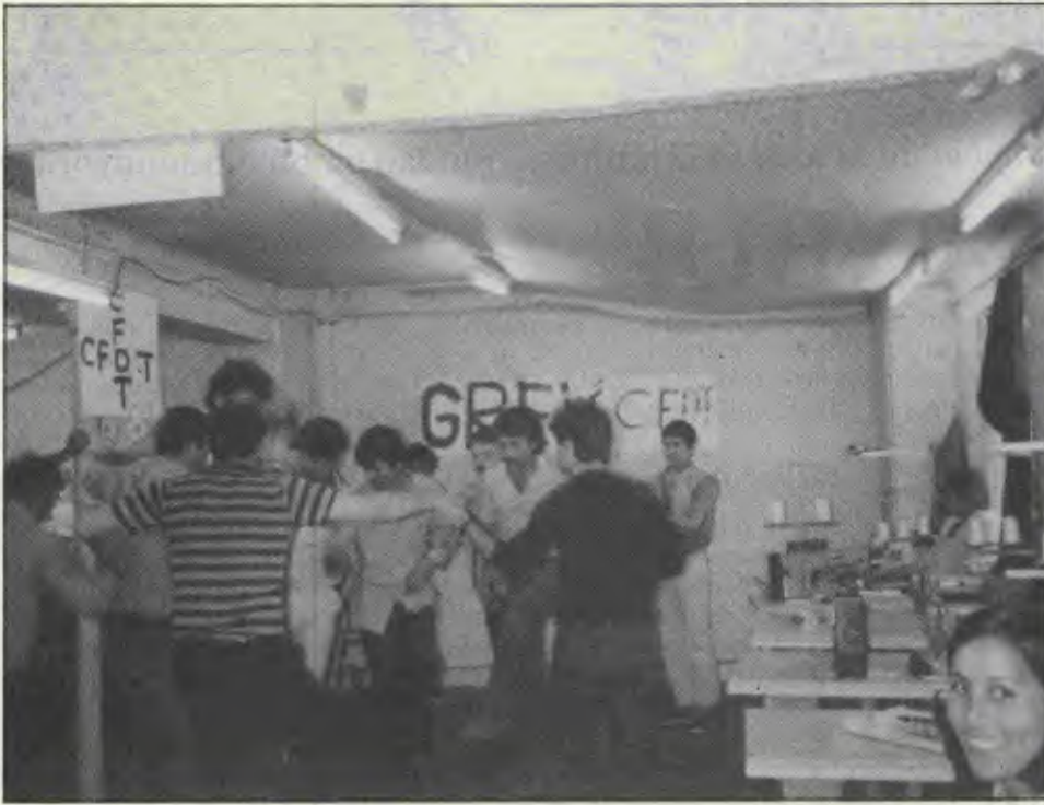
Pazar şenliğinde grevcilerle birlikte halay