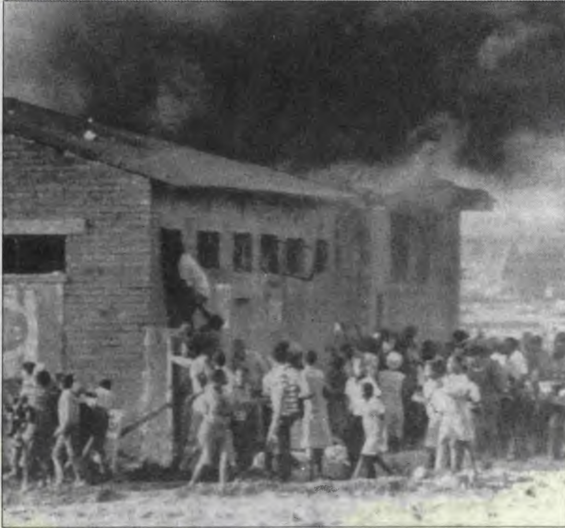
Hiçbir güç ırkçı rejimi emekçilerin gazabından kurtaramayacaktır

Anayasanın yürürlüğe girdiği gün büyük endüstri kenti Johannesburg'un varoşlarında yaşayan binlerce emekçiyi sokağa döken şey, "ırkçılık" yanısıra fiyat artışları, elektrik parasının, kiralardan hükümetçe arttırılmasıydı. Yığınların sokağa dökülmeleri yalnızca bir yerde kalmadığı gibi, kısa zaman içinde çevre kasabalara yayıldı. 1960 yılında