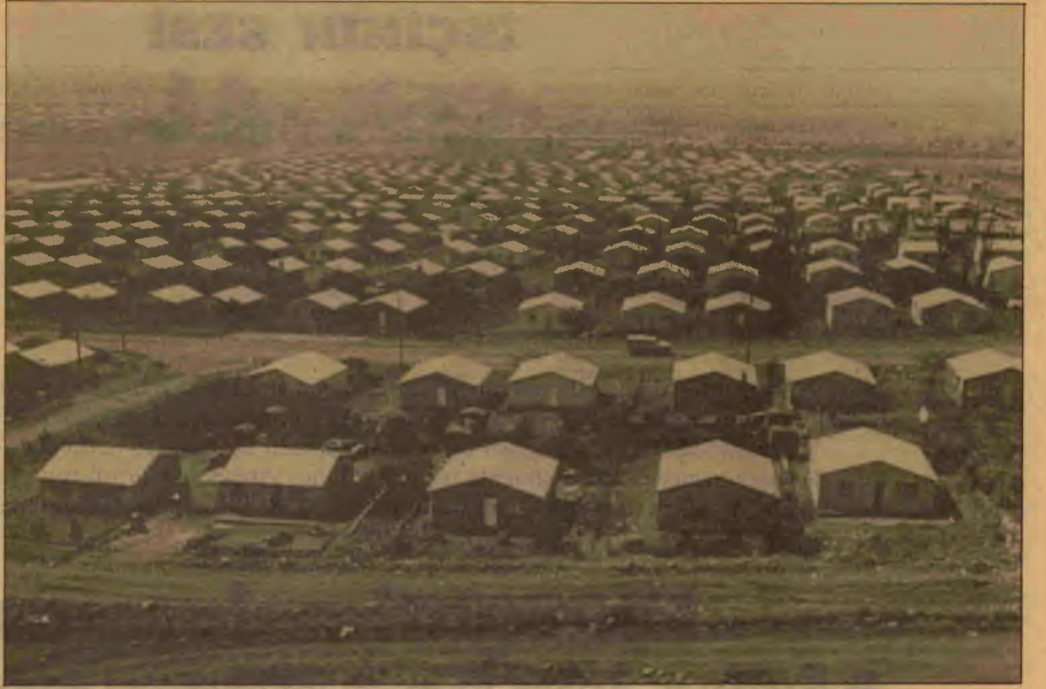
Soweto'nun genel görünümü

Anlaşma öncesi siyaset neydi? Güney Afrika propaganda makinalarının söylediklerine bakılırsa, cephe devletlerine karşı izlenen siyaset genel olarak dostça işbirliği aramaya yönelmiştir. Özel olarak Mozambik'e karşı izlenen siyaset de yalnızca sınırlardan Güney Afrika'ya silahlı devrimci saldırıyı önlemek için ANC-Umkhonto kamplarına girişilen saldırıyla ilgilidir. Durum böyleyse, neden MNR köpekleri, ANC'nin üslerine değil de daha çok asıl hedefleri olan Mozambik'in önemli endüstri ve ulaşım merkezlerine saldırıyorlar? MNR, Güney Afrika'nın Mozambik'teki delegesiydi, belki de hâlâ öyledir. Onun amaç ve hedefleri Güney Afrika'nın amaç ve hedefleridir. Bu hedefler, ANC'nin ırkçılığa karşı devrimci çabalarını asla önleyemedi ama Frelimo hükümetine, onun Mozambik'i yeniden kurma ve geliştirme çabalarına her zaman zarar verdi. Şimdi ANC'nin Mozambik'teki varlığı ciddi olarak azaltıldığından dolayı artık Güney Afrika'nın Frelimo hükümetinin