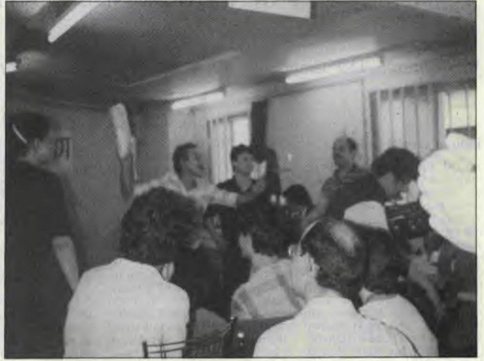
Paris İşçi Birliği'nin grevcilerle birlikte düzenlediği pazar şenliğinde açık arttırma yapılırken