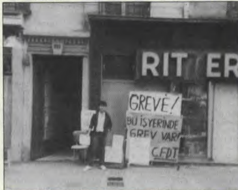
Atölyenin önündeki grev pankartı