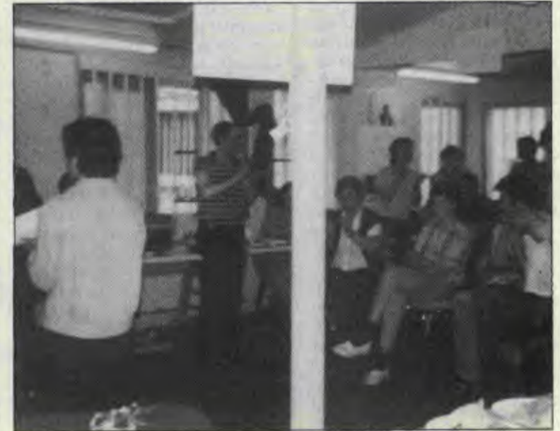
Bir pazar şenliğinden görüntü