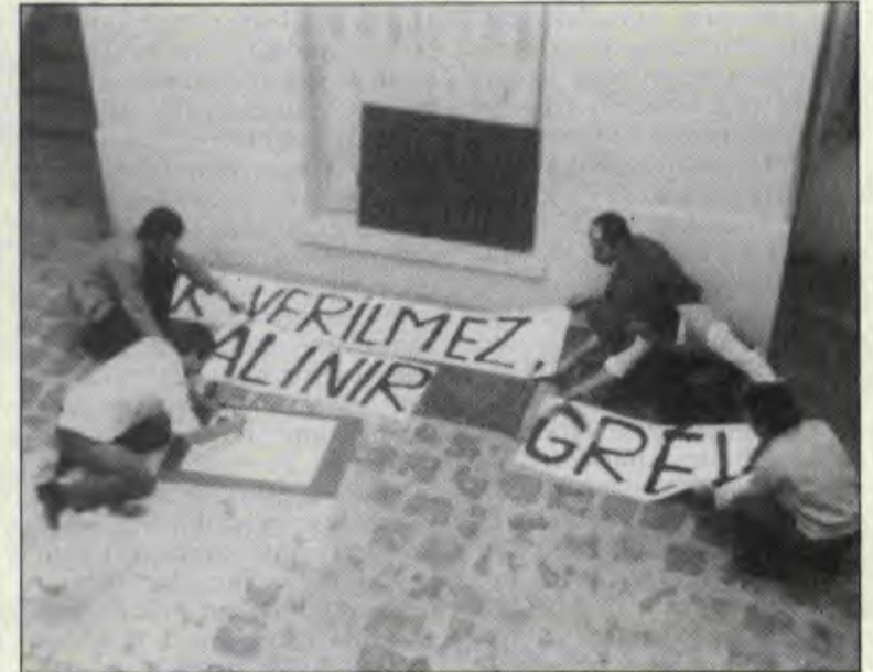
Grev öncesi hazırlıklar sırasında