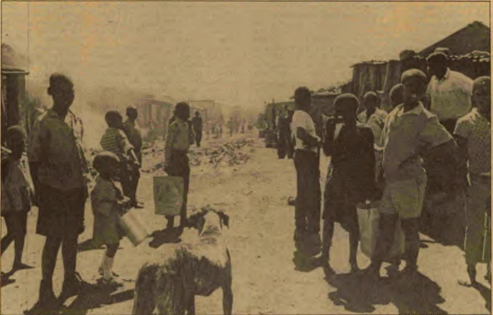
Dünyanın en modern şehirlerinden biri olan başkent Johannesburg yakınlarında kurulu yalnızca siyahların yaşadığı 1 milyonluk Soweto şehriden bir görüntü

B ir kez daha anladık ki geleceğin neler getireceği önceden kestirilemez. Bir yıl önce, Afrika'daki siyasal gelişmeleri kim tahmin edebilir, son aylardaki olayları kim önceden görebilirdi? Hangi araştırmacı Frelimo partisinin yönettiği Mozambik hükümetinin nisan 1984'te Güney Afrikalı devrimci kadroları sınır dışı edeceğini söyleyebilirdi? Kim Mozambik-Güney Afrika komisyonunun ortak denetimi altında Afrika Ulusal Kongresi (ANC) üyelerinin evlerine ve Maputo'daki binalarına baskınlar düzenleneceğini öngörecektir kadar cesaretli konuşabilirdi?